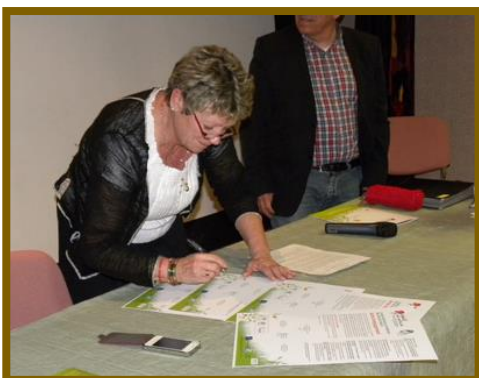
Signature du PNR du Pilat

26 mars 2015 : Signature de la charte par la commune des Houches.