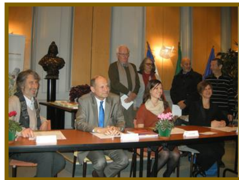
Signature de Bourg-en-Bresse

17 juin 2015 : Signature de 23 communes dans le cadre du contrat de rivière Séran : Artemare, Belmont-Luthezieu, Brénaz, Ceyzérieu, Champagne-en-Valromey, Chavornay, Cressin-Rochefort, Culoz, Flaxieu, La Grand Abergement, Le Petit Abergement, Lochieu, Lompnieu, Saint Champ, Saint-Martin de Bavel, Sutrieu, Talissieu, Vieu, Virieu-le-Petit, Vongnes, Polliou, Nurieux-Volognat, Songieu, Lavours.