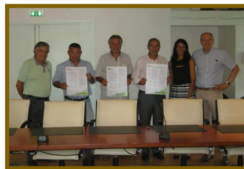
Signature des communes de la Bulle verte

29 juin 2015 : Signatures des 3 communes de l'impluvium de Badoit (Saint-Galmier, Chamboeuf et Saint-Médard-en-Forez) aux côtés de la Bulle verte, de la FRAPNA et du SIMA Coise.