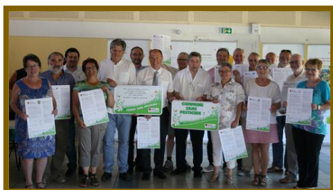
Signature de 18 communes du Gier

30 mars 2015 : Signature de Pont-Trambouze dans le cadre du contrat de rivières Rhins-Rhodon-Trambouzan.