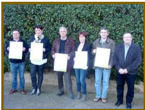
Signature de 5 communes du bassin Ay-Ozon